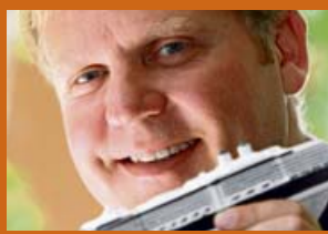
Von Jörg A. Boeckmann www.cruceros.es www.kreuzfahrten-ab-palma.es

Auch wenn an dieser Stelle bereits mehrfach auf die unterschiedlichsten Luxus-Schiffe eingegangen wurde, ist der Name Crystal Cruises dabei bisher nur selten aufgetaucht. Das liegt insbesondere daran, dass die 1988 gegründete Reederei über viele Jahre mit lediglich zwei Schiffen auf dem Markt präsent war, Palma nur selten angelaufen wurde und die große Mehrheit der Passagiere nicht aus Europa, sondern aus Nordamerika und Japan kamen. Jetzt aber ist der Anlauf der „Crystal Symphony“ in Palma und die auch für Deutschland spannende Entwicklung des Mutterkonzerns Anlass genug, diese Schiffe einmal näher zu betrachten.