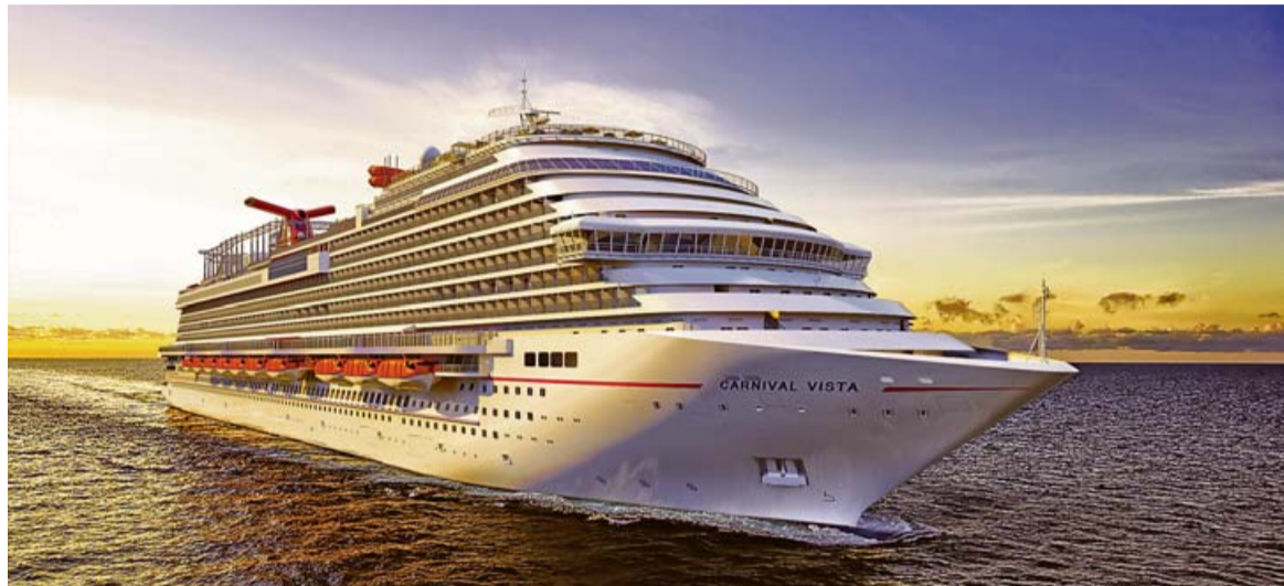
■ Erst ein paar Wochen in Betrieb und schon in Europa: die „Carnival Vista“, hier auf einem stilisierten Reederei-Bild.

An Bord der „Carnival Vista“. Das neue US-Schiff legt an diesem Freitag in Palma an