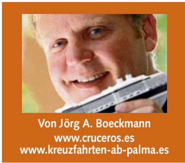
Von Jörg A. Boeckmann www.cruceros.es www.kreuzfahrten-ab-palma.es