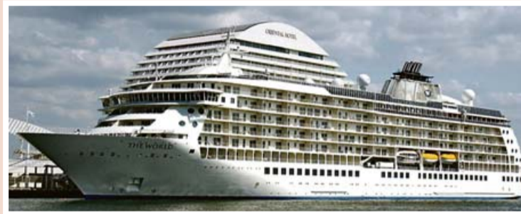
■ Schwimmendes Apartmenthaus: „The World“.

21.7.–22.7. MSC Poesia (21–5 Uhr) 23.7. TUI Discovery (6–23 Uhr) 23.7. AidaBlu (6–22 Uhr) 23.7. Aida Stella (6–22 Uhr) 23.7. Seven Seas Explorer (12–23 Uhr) 23.7.–25.7. The World (13–23.59 Uhr) 24.7. Mein Schiff 3 (4–22 Uhr) 24.7. Star Breeze (8–17 Uhr) 25.7. Harmony of the Seas (8–16 Uhr) 25.7. MSC Armonia (15–23.59 Uhr) 26.7. Thomson Majesty (6–23 Uhr) 26.7.–27.7. Costa Diadema (9–1 Uhr) 26.7. Costa Fascinosa (9–18.30 Uhr) 26.7.–27.7. MSC Fantasia (14–0.30 Uhr) 27.7. Star Pride (8–18 Uhr) 28.7.–29.7. MSC Poesia (21–5 Uhr) 29.7. Celebrity Equinox (8–17 Uhr) 30.7. Aida Stella (6–22 Uhr) 30.7. TUI Discovery (6–23 Uhr)