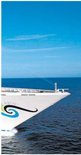
Schiff im Schiff.

Für Royal Caribbean, die Reederei mit den momentan größten Schiffen, liegen die Schwerpunkte weniger in der Gastronomie als im Entertainment und der spektakulären Schiffsarchitektur – ein Bummel durch den „ersten Central Park auf See“ auf dem Megaliner „Oasis