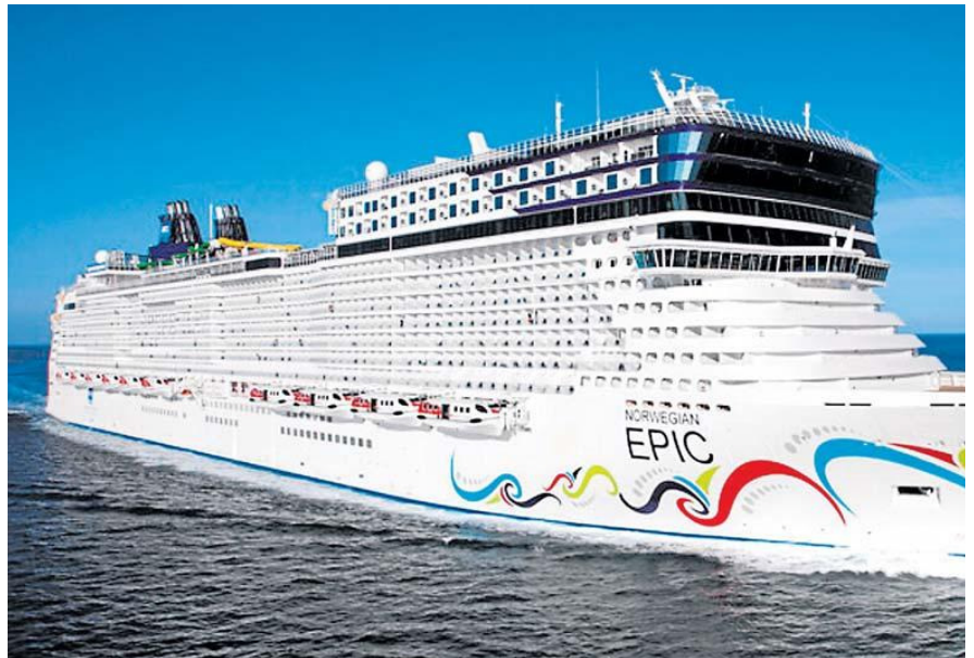
■ Ab Mai 2013 regelmäßiger Gast in Palma: der NCL Megaliner „Norwegian Epic“.

Zu den ganz großen Schiffen, die in diesem Jahr Palma besucht haben, gehört die „Norwegian Epic“. Ich konnte sie im April ausführlich in Augenschein nehmen. Die bis zu 4.100 Passagiere finden auf dem 329 Meter langen amerikanischen Kreuzfahrer die unterschiedlichsten Angebote, etwa einen AquaPark, eine gigantische