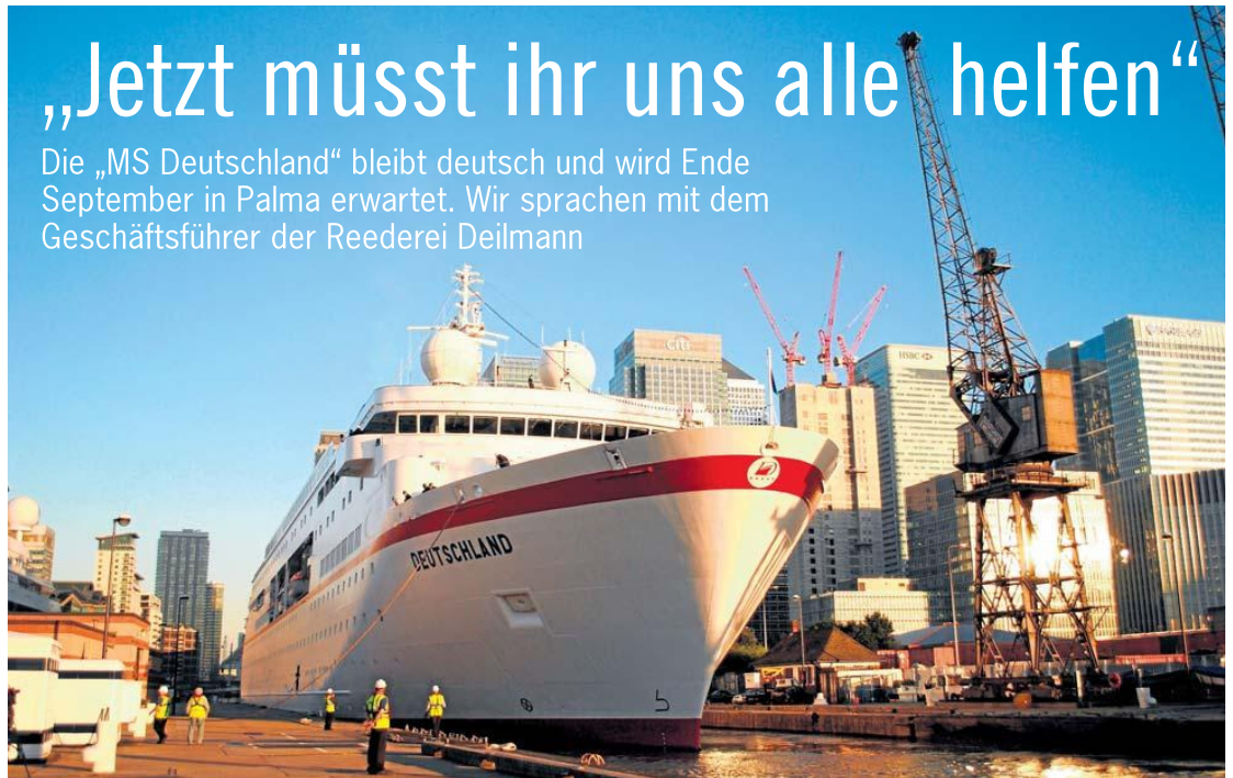
■ Beeindruckender Liegeplatz: die „MS Deutschland“ an den West India Docks in London.

Zu dieser Entscheidung hat das große öffentliche Interesse geführt aber auch die Zusagen von unterschiedlichsten Seiten bezüglich unserer Unterstützung. Die Bericht-