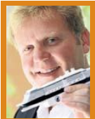
Jörg A. Boeckmann www.cruceros.es www.kreuzfahrten-ab-palma.es

Megaliner mit einer Schiffsgröße von über 100.000 Bruttoregistertonnen sind die Superlative der Weltmeere. Sie locken mit immer spektakuläreren Attraktionen